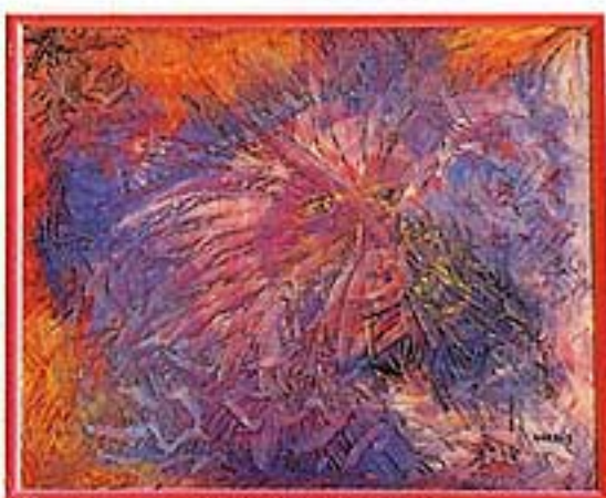
参考作品「星空の滝」